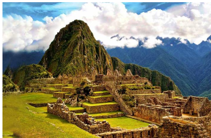
Machu Picchu, Peru

Wenn du Interesse daran hast, Spanisch zu erlernen, ist es zunächst einmal wichtig, dass du viel Spaß an der Sprache und an dem Erlernen einer neuen Fremdsprache mitbringst. Ohne Spaß klappt auch die beste Lernmethode nur halb so gut. Zu dem Spaß und dem Interesse sollte sich allerdings auch die Bereitschaft gesellen, die Vokabeln und die Grammatik in regelmäßigen Abständen zu lernen und zu wiederholen. Wenn dir Englisch leicht fällt und es dir Spaß macht, dich in einer Fremdsprache zu verständigen, bist du in diesem Kurs an der richtigen Stelle.