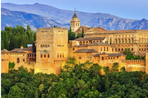
La Alhambra in Granada

Unterschiedliche Methoden und eine Abwechslung zwischen dem Erlernen des Mündlichen, des Schriftlichen und der Kultur des spanischen Sprachraumes helfen bei dem ganzheitlichen Lernen der Sprache.