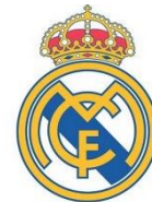
el Real Madrid