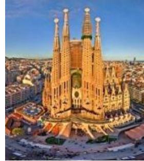
La Sagrada Família in Barcelona